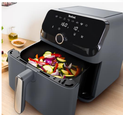
Gesunde Gerichte im Handumdrehen