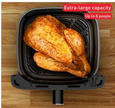
Extra große Kapazität