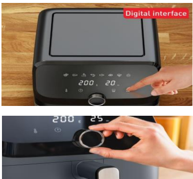
Einfache Bedienung (digitales Touchdisplay und Drehknopf)