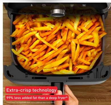
Extra Crisp Technologie - 99% weniger Fett