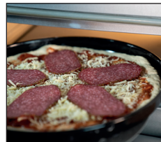
Pizzabackform für Pan-Pizza